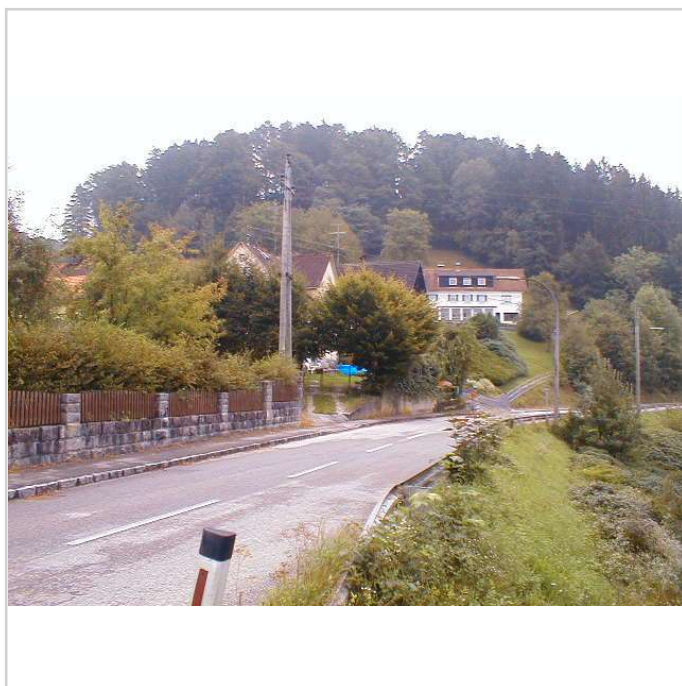
02 Auffahrt zum Grundstück